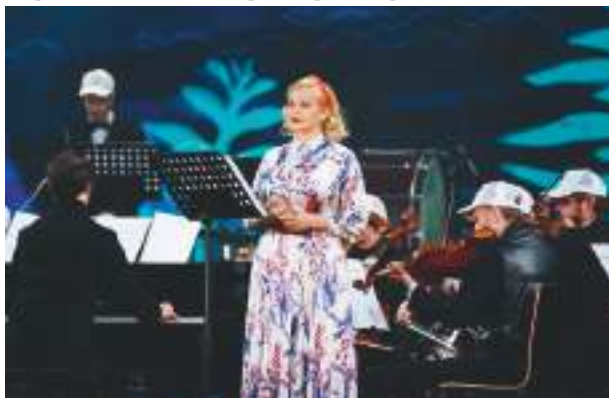
Ирина Пегова: «Такие фестивали нужны прежде всего детям, чтобы они узнавали, что такое классическая музыка и другие виды искусств».