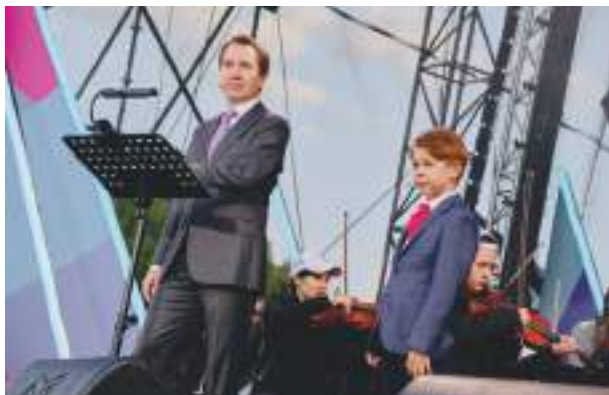
Евгений Миронов: «Это мультижанровый фестиваль, и его задача в том, чтобы дети не только через искусство, но и через науку, спорт и образование постигли все разнообразие мира».