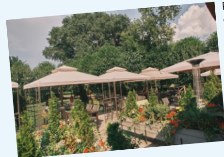
ЛЯ КАМПАНИЯ ДЛЯ ПОСНАЕСТОК С ДРУЗЬЯМИ

Ресторан «Меркато» обновился и получил название «Ля кампания». Полюбившиеся огромная летняя веранда и лавка, где можно купить фрукты и лимонады, по-прежнему встречают посетителей в тихом месте парка.