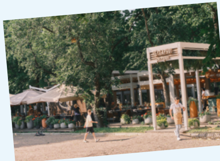
ЧЕХАРЧО! ДЛЯ ГАСТРОНОМИЧЕСКИХ ОТКРЫТИЙ

Если вы любитель атмосферных веранд – особенно советуем этот ресторан. Здесь вас всегда встретят с южным гостеприимством. Блюда черноморской кухни – это прекрасно, но как насчет специального меню? До конца августа в Че? Харчо! подают любимые блюда А.С. Пушкина и десерты по мотивам его сказок в авторском прочтении шеф-повара Руслана Буй.