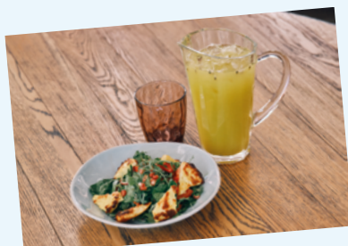
Жареный халуни с томатами и зеленью, лимонад яблоко-маракуйя