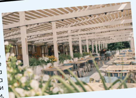
ЖАРОВНЯ В ЛЮБОЙ НЕПОДАВАЮЩЕЙ СИТУАЦИИ

Если потеряли из виду любимый гриль-бар – он переехал к Спортивному центру. В меню – по-прежнему полюбившиеся блюда на любой вкус: различные закуски, десерты, а еще особенно сочные мясо, рыба и овощи, приготовленные на гриле и угольной печи.