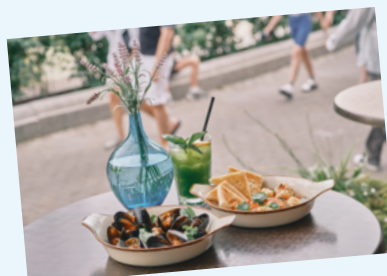
Мидии в томатно-сливочном соусе с горгонзоллой, креветки в тайском соусе с хрустящей чиабаттой, лимонад зеленый базилик