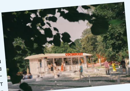
ПЕТАНК-КАФЕ СОСНОНЕТ ДЛЯ НАСТОЯЩЕГО ЛЕТНЕГО НАСТРОЕНИЯ

Этот уголок Парка Горького воплощает мечты об идеальном лете: диджей-сеты под открытым небом, чарующие закаты, нескучная еда, и конечно, неизменная точка притяжения – петанк. Эта изюминка заведения одинаково разжигает азарт в играх любого возраста. А фирменные освежающие напитки в летний зной добавляют беззаботности и немного легкомыслия.