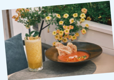
Томатный гаспачо с магаданскими креветками, смузи маракуйя