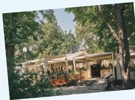
СЫРОВАРНЯ ДЛЯ СЫРНЫХОВ