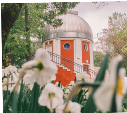
Подробнее об Обсерватории

кольцами. Ближе к середине сентября список пополнится самой большой планетой Солнечной системы – Юпитером с его «галлиевыми» спутниками. Во второй половине сентября, возможно, получится увидеть и Марс. Ждем вас на наших астрономических экскурсиях!