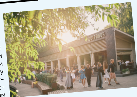
ОСТРОВК ДЛЯ ТИХОГО ОТДЫХА

Кафе-терраса на берегу Голицынского пруда создает полное ощущение загородного отдыха вдали от городского шума. Меню сочетает классику европейской кухни с оригинальными авторскими интерпретациями, поэтому найти «то самое» блюдо будет довольно просто. Классный бонус – по вечерам в «Островке» проводятся дегустации.