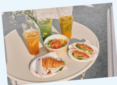
Круассан с индейкой, пита с лососем, паке с лососем, лимонад манго, лимонад тархун, лимонад цитрусовый