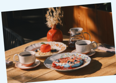
Креме с корицей, беже Павлова, чай смородина-фиалка-мята