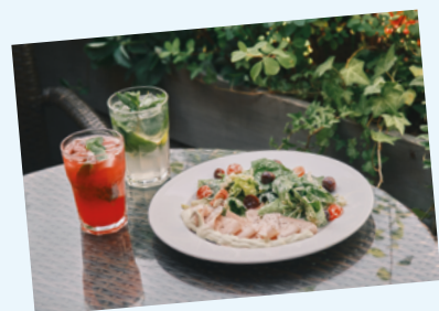
Зеленый салат с пастрами из индейки и бальзамическим виноградом, мохито, лимонад малина-мята