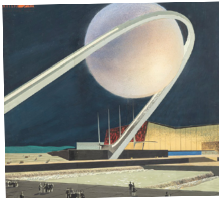
Музей архитектуры имени А.В. Щусева

пример советского архитектурного модернизма. Экспонаты рассказывают о поисках архитекторов в сфере строительства специализированных зданий и общественных центров для исследователей: это более 250 работ из фондов 23 музеев, архивов и коллекций наследников мастеров, среди них живопись 1960–1980-х гг., архитектурная и художественная графика, макеты, фотографии и технические изделия.